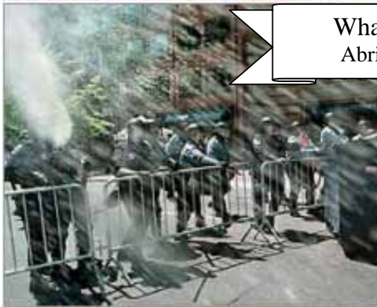
Whashington Abril de 2000