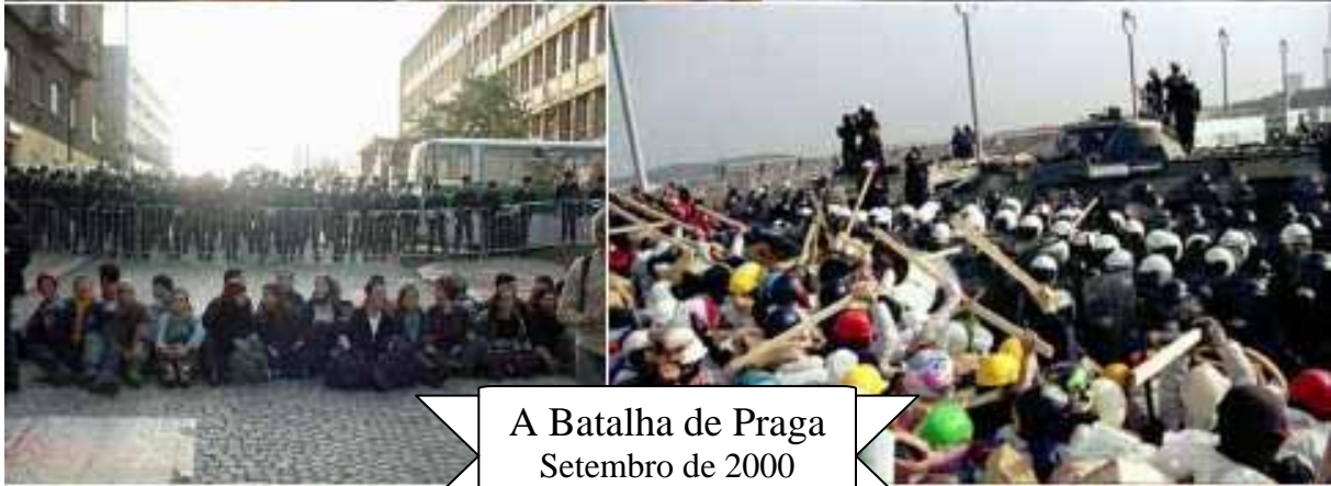
A Batalha de Praga Setembro de 2000