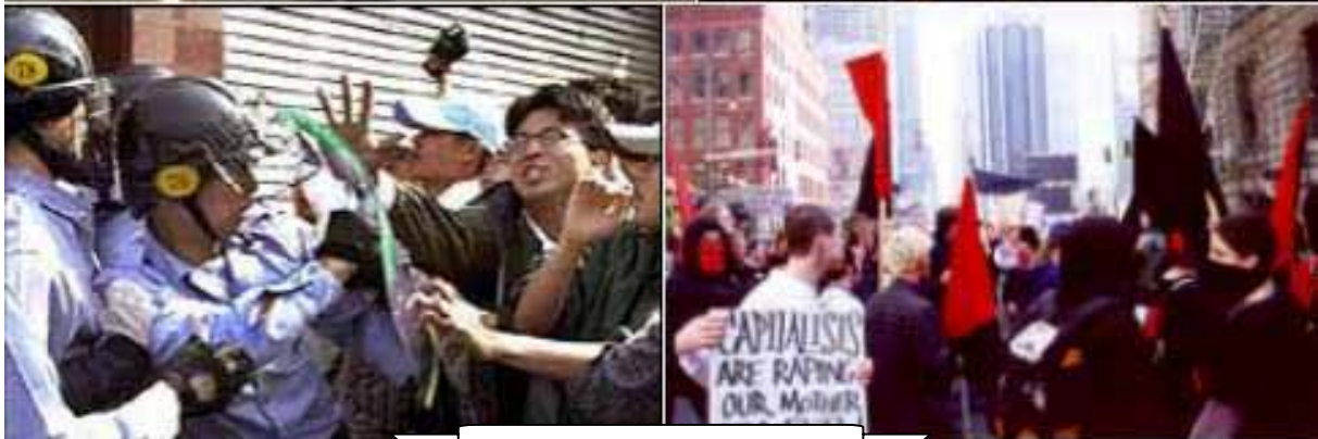
Reação Global Maio de 2000